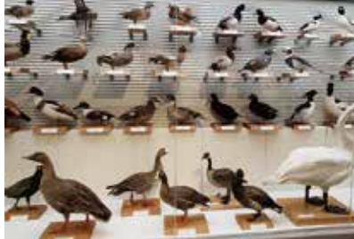
カモの仲間の標本展示

鳥の博物館では、開館以来、日本産鳥類全種の剥製標本の収集を進めており、現在までにその6割ほどにあたる389種の標本を収蔵しています。日本の鳥コーナーでは、これらの標本をできるだけ多く展示し、地域や環境、季節によっても異なる日本の鳥の多様性をご紹介します。