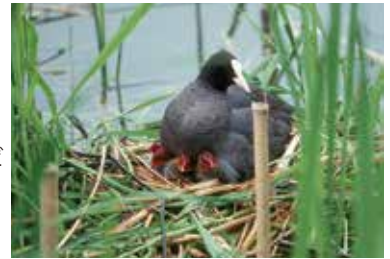
子育てをするオオバン

集合場所：鳥の博物館玄関(雨天中止) 申込み：Tel.04-7185-2212 参加費：高校生以上100円(保険料として) 定員：20名 ※5月2日(火)より申込み開始