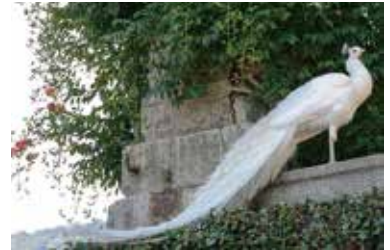
白いジャコもたいていアルビノではありません

本来の羽色とは違う白い羽色異常の鳥が見られることがあります。アルビノと呼んでいる例もありますが、野外でアルビノが見つかることはほぼありません。ではなぜ白いのでしょうか？白くなるメカニズムはいくつかありますが、よく観察するとどのような異常なのかわかるかもしれません。参加費無料・申込み不要 詳細は右記QRコードをご確認ください。