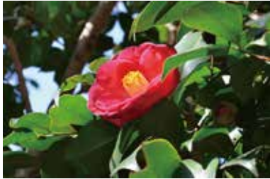
記念館庭園の椿・明石渦

ジャーナリスト・杉村楚人冠が、我孫子の湖畔での生活を吟じ人気を博した随筆『湖畔吟』。今回はそんな『湖畔吟』を彩る花々を、随筆の文章と共にご紹介します。