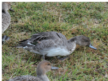
埼玉鴨場で標識放鳥されたオナガガモ

開館9:30～16:30(入館は16:00まで) 休館日：月曜(祝日の場合は翌平日) 所在地：千葉県我孫子市高野山234-3 TEL：04-7185-2212 入館料：一般300円 高校・大学生200円 中学生以下無料 70歳以上の方・障がい者と介助者1名無料