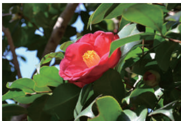
記念館邸園の椿・明石瀧

ジャーナリスト・杉村楚人冠が、我孫子の湖畔での生活を吟じ人気を博した名随筆『湖畔吟』。そんな『湖畔吟』を彩る花々を、随筆の文章と共にご紹介します。