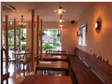
優しい灯りの店内は雰囲気抜群!