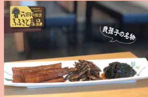
「うなぎの大和煮」「ざっこのつくだ煮」「甘口昆布」は、我孫子市ふるさと産品に推奨されている人気商品です。

ぜひ、安井家にお越しください! 7/28~7/30 限定 柏高島屋地下1階にて「うなぎ弁当 ¥4,180 (税込)」を販売 お待ちしております!