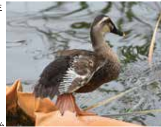
翼を換羽中のカルガモ