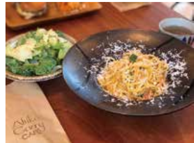
本日のパスタランチ (スープ・サラダ付き) ¥1,300 (税込)