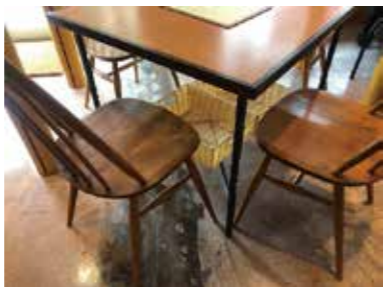
こだわりが詰まったおしゃれな家具