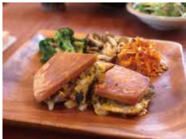
本日のACサンドプレートランチ (スープ付き) ¥1,300 (税込)