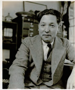
式場隆三郎 (1937年 39歳)

1920年雑誌『白樺』に影響を受け、柳宗悦を訪ねて我孫子にやってきた式場隆三郎(1898-1965)。式場は精神科医、民藝運動の推進者として活躍し、山下清を広く紹介した人物でもあります。本展では、医療、文学、美術などジャンルを超え多彩な活動を展開した式場の業績を紹介します。