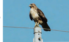
タカの仲間のノスリ

秋になると、冬を越すために多くのノスリたちが西日本に渡ってきます。普通種ゆえに見過ごされがちですが、越冬地のノスリをよくよく観察してみると、やけに色の濃い個体が混じっていたり、繁殖地でもないのに2羽で一緒にいるなどの興味深い行動を示す個体がいっぱいあります。今回は、越冬地のこうした一見「普通ではない」個体のDNAを調べ、GPSロガーを用いて追跡することで判明した、ノスリの進化や生態に関する新たな知見を紹介します。