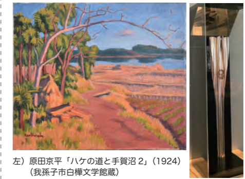
左) 原田京平「ハゲの道と手賀沼 2」(1924) (我孫子市白樺文学館蔵) 右) 東京 2020 オリンピック聖火リレートーチ

我孫子市教育委員会蔵コレクション初公開! 日時: 8月18日 (金)~23日 (水) 10:00~18:00 ※最終日 13:00 まで 会場: 我孫子市民プラザギャラリー (千葉県我孫子市我孫子 4-11-1) 入場料: 無料