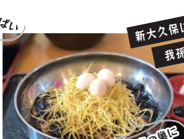
左) 天王台海鮮ちゃんぽん (赤・白) ¥1,300 (税込) 右) 天王台鳥巢ジャーザー ¥1,200 (税込)