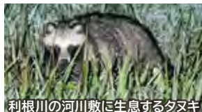
利根川の河川敷に生息するタヌキ

日時：12月2日(土) 16:00～19:00(雨天中止) 場所：利根川ゆうゆう公園野球場駐車場 内容：夜になると河川敷に出てくるタヌキ・ノウサギなどの哺乳類や、夜行性の鳥たちを観察します。 持ち物：歩きやすい靴と服装、防寒着、お持ちの方は双眼鏡・懐中電灯。 参加費：高校生以上100円(保険料として) 申込み：☎04-7185-2212 先着20名(小学生以下は保護者同伴) ※11月20日(月)より申込み開始