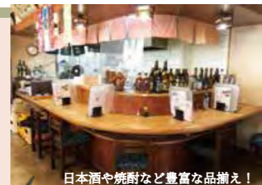
日本酒や焼酎など豊富な品揃え！