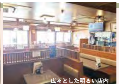
広々とした明るい店内