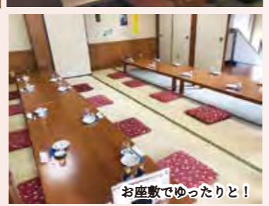
お座敷でゆったり！