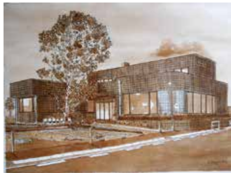
我孫子市民図書館 布佐分館

我孫子市周辺の名所旧跡、風景、イベントなどその魅力を透明水彩で描いた新作・旧作品の集大成。