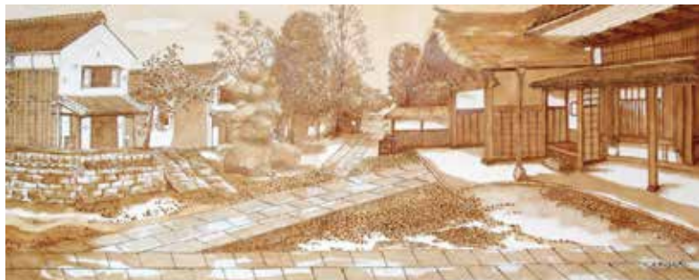
旧井上家住宅 (国登録有形文化財・我孫子市指定文化財)