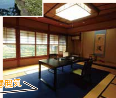
落ち着いた雰囲気