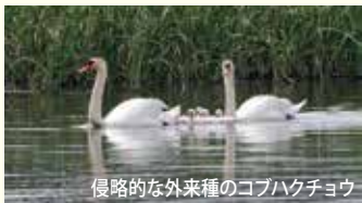
侵略的外来種のコバクチョウ

※新型コロナウイルスの感染対策のため、開催時間や申込方法を変更することがありますので、事前に鳥の博物館のウェブページをご確認ください。