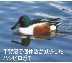
手賀沼で個体数が減少したハシビロガモ