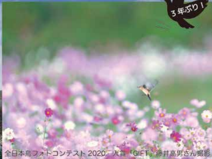
全日本鳥フォトコンテスト 2020 入賞「GIFT」

ジャパンバードフェスティバル実行委員会 (事務局：手賀沼課 TEL04-7185-1484)