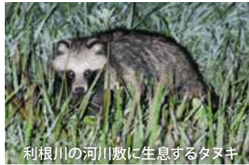
利根川の河川敷に生息するタヌキ