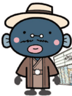
我孫子市マスコットキャラクター 手賀沼のうなきちさん