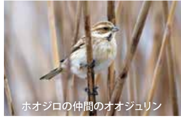
ホオジロの仲間のオオジュリン

てがたんコースでは、冬に 4 種のホオジロ科の鳥たちが見られます。それぞれ種の食べものや暮らす環境に注目して観察してみましょう。