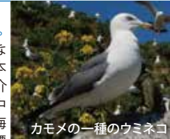
カモメの一種のウミネコ

日時: 12月24日(土) 13:30~14:15 ※今回に限り、第三土曜日から変更して実施します。 参加費無料・申し込み不要 詳細は右記QRコードをご確認ください。ご紹介いたします。