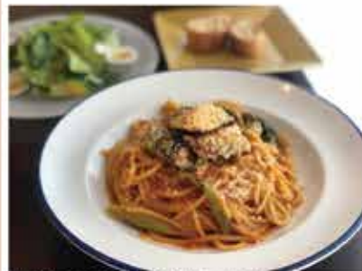
サワラと菜の花のトマトソース