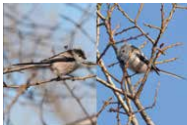
通常のエナガ(左)と眉の薄いエナガ(右)