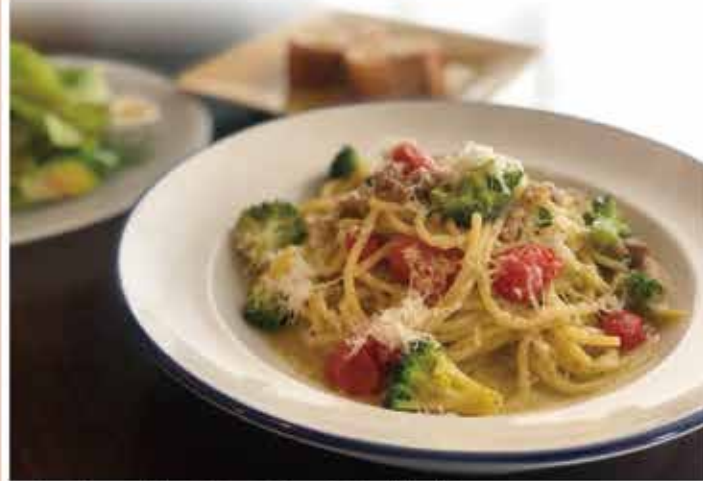
パンチェッタとブロッコリーのプーリア風