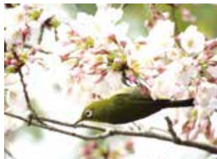
サクラの花にやってきたメジロ

鳥のサイエンストーク 山階鳥類研究所所員や鳥の博物館学芸員によるオンライン講演会です。